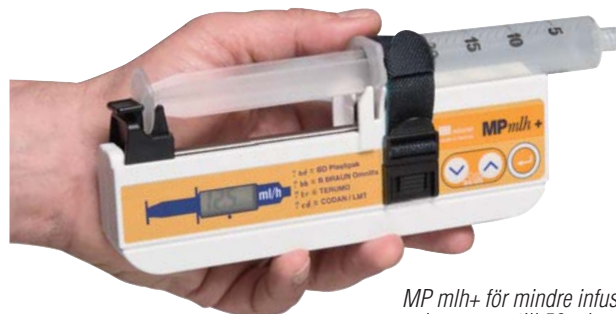
MP mlh+ för mindre infusionsvolymer, upp till 50 ml. Kompatibel med alla standard sprutmärken.