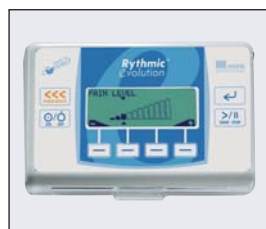
Mini Rythmic Evolution