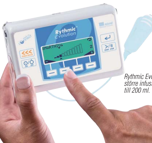
Rythmic Evolution pumpar för större infusionsvolymer, upp till 200 ml.