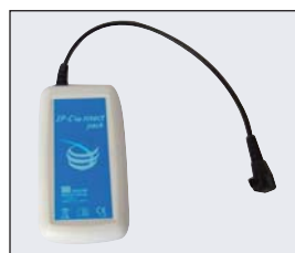
IP Connect Pack för anslutning till MicrelCare