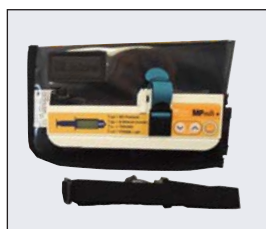
MP+ Låsbar väska