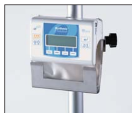
Rythmic Evolution på droppställning