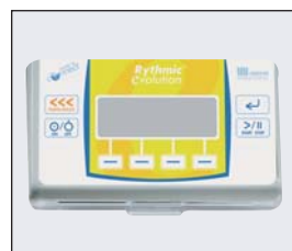
Mini Rythmic Evolution Gul